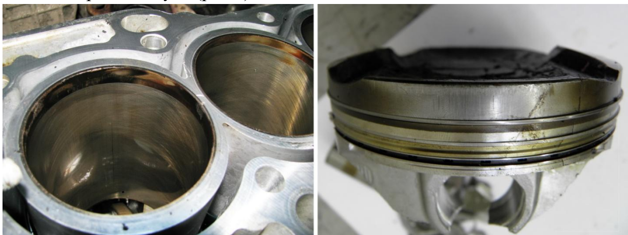
Рис.3. Главный признак гидроудара - расширение пояса нагара в верхней части цилиндра (слева), и один из подтверждающих признаков - стертый нагар над отверстием поршневого пальца (справа), свидетельствующий о деформации шатуна и работе поршня

Для правильного определения причины необходимо решать обратную задачу, а именно - установить признаки, которые появились на деталях вследствие начального повреждения еще в то время, когда они сохраняли работоспособность. Тогда, если знать и обнаружить все такие признаки, можно установить не только факт, но и причину гидроудара. Например, несмотря на то, что шатун мог превратиться во множество обломков, величину деформации шатуна, которую он имел до разрушения, всегда можно легко измерить. Совершенно очевидно, что у поршня, "осевшего" из-за осевого сжатия шатуна, верхнее поршневое кольцо не доходит до своего штатного положения в ВМТ, в результате чего пояс нагара в верхней части цилиндра при сгорании топлива расширяется вниз на величину осевого сжатия стержня шатуна (рис.3).