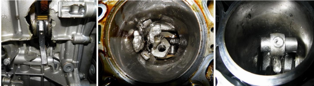
Рис.1. Последствия тяжелых повреждений ДВС при гидроударе (слева), масляном голодании (в центре) и обрыве клапана (справа).

тяжелыми повреждениями ДВС и их причинами являются (рис.1): 1) деформация и последующее разрушение стержня шатуна в результате попадания жидкости в полость цилиндра (т.н. гидроудар), 2) разрушение шатунного подшипника и нижней головки шатуна вследствие масляного голодания, 3) разрушение клапана преимущественно из-за ошибок сборки.