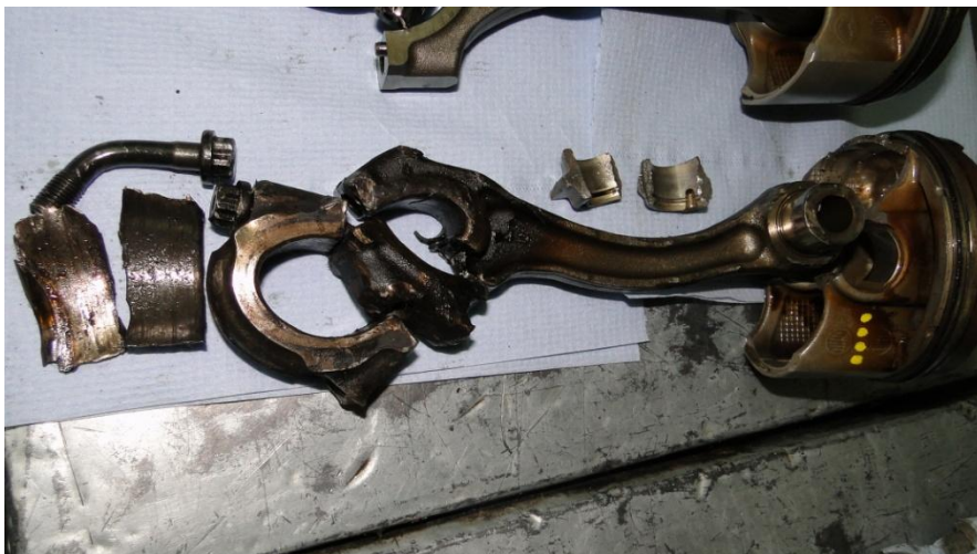
Рис.7. Пример сочетания главного признака масляного голодания (усталостное разрушение нижней головки шатуна) с комплексом подтверждающих признаков (перегрев нижней головки, частичное разрушение поршня и полное разрушение шатунного подшипника).

неисправность маслонасоса, засорение маслосистемы отложениями, а также различные ошибки при ремонте и прочие причины.