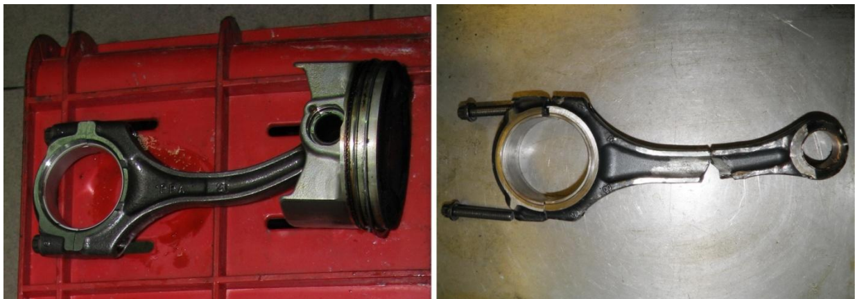
Рис.2. Шатун, деформированный при гидроударе (слева), неизбежно разрушится по стержню через определенное число циклов (справа).

Общим для средней и слабой деформации шатуна является появление при дальнейшей эксплуатации нештатных изгибающих нагрузок на деформированный стержень шатуна, при наличии которых стержень практически неизбежно разрушится от усталости через определенное время эксплуатации (рис.2).