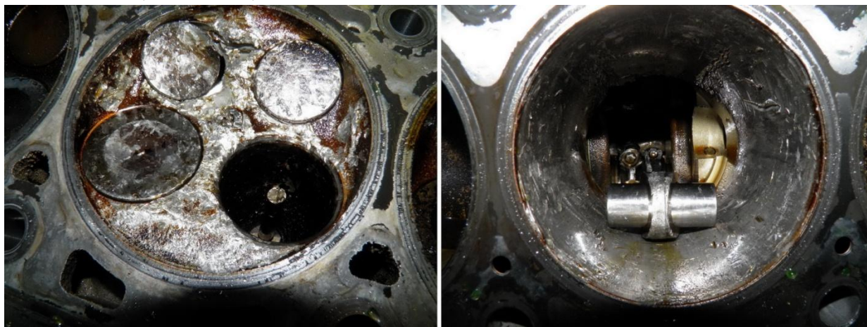
Рис.5. Главный признак поломки клапана вследствие дефекта сборки - отсутствие тарелки в седле (слева) и разрушение поршня (справа), при наличии подтверждающих признаков - отсутствии разрушения пальца и шатуна.

Главным признаком неисправности данного вида, очевидно, является отсутствие головки клапана на ее штатном месте в седле (рис.5). Однако в отличие от главного признака гидроудара, отрыв головки может иметь не только первичный (усталостное разрушение), но и вторичный характер (мгновенное ударное разрушение от взаимодействия с обломками поршня). Поэтому для определения причины разрушения важны подтверждающие признаки, например, имеется ли следы ударов клапанов на поршнях соседних цилиндров, разрушен ли шатун и поршневой палец, поврежден или полностью разрушен поршень, а также какова степень износа нижней головки шатуна и шатунного подшипника.